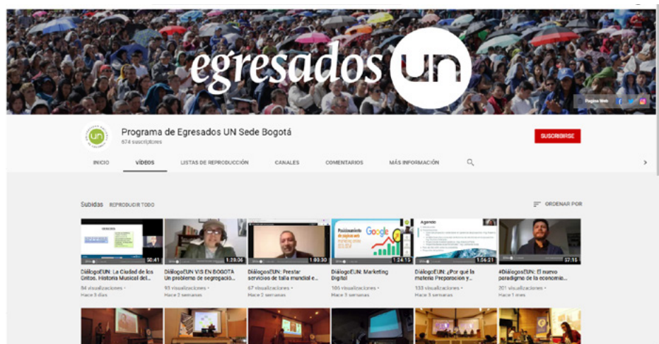
Canal oficial de Youtube del Programa de Egresados - Sede Bogotá

De acuerdo con la disponibilidad de recursos humanos y técnicos, los eventos podrán contar con grabación audiovisual para su posterior publicación en el canal oficial de Youtube del Programa de Egresados Sede Bogotá.